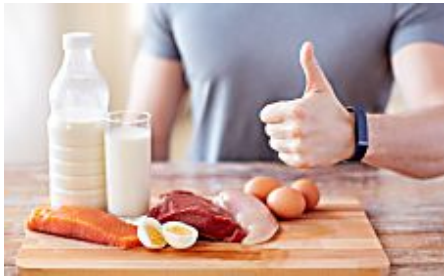
Low-Carb-Diät: Weniger bekannte Gesundheitsgefahren