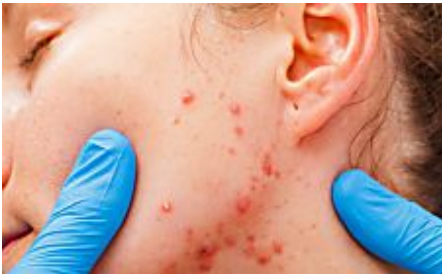
Akne im Alter: Warum eitrige Pickel nicht ausgedrückt werden