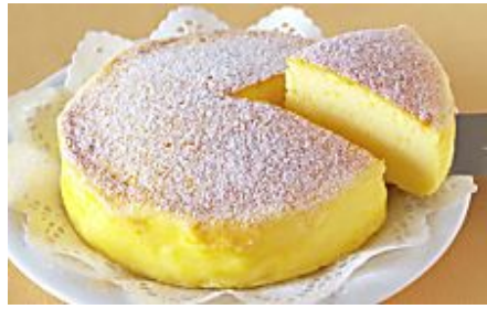
Kochbar - Sponsored Japanischer Soufflé- Käsekuchen mit nur 3 Zutaten