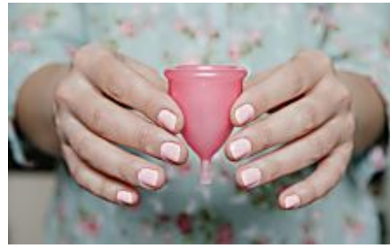
Umfragen: Menstruationstassen können das